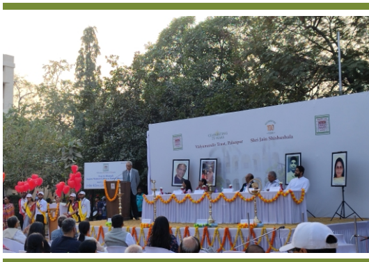
૭૫ વર્ષની ઉજવણી