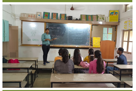
સ્વયં શિક્ષક દિન