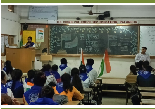
હર કોલેજ તિરંગા અને દેશભક્તિ ગીત સ્પર્ધા