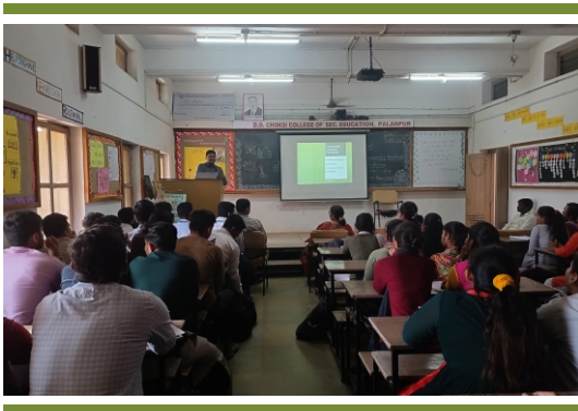
પ્રાયોગિક પેડાગોજી શિબિર