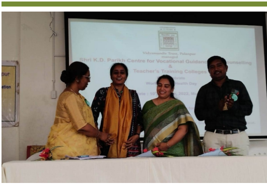
વિશ્વ માનસિક સ્વાસ્થ્ય દિવસ