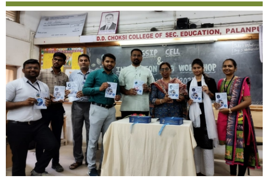
SSIP સેલ અને ઈનોવેશન ક્લબ શિબિર