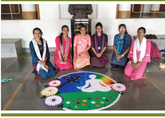
હૉલિસ્ટીક વેલનેસ શિબિર અને રેડીયો સ્ટેશનનો શુભારંભ