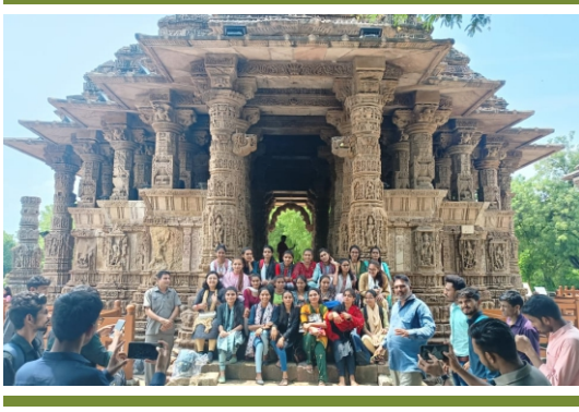
મોઢેરા - સૂર્યમંદિર પરિચય પ્રવાસ