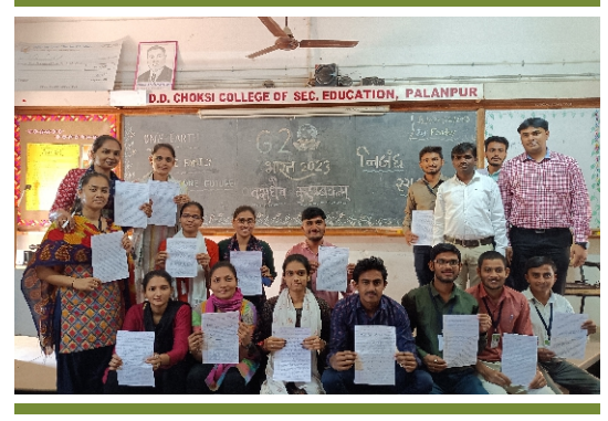
G20 નિબંધ સ્પર્ધા