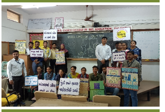
વિશ્વ ગ્રાહક અધિકાર દિવસ