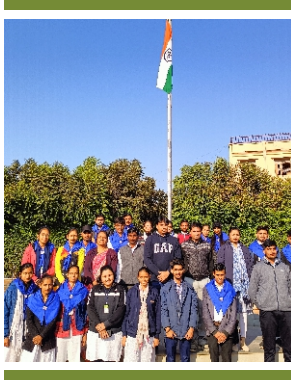
ગણતંત્ર દિવસની ઉજવણી