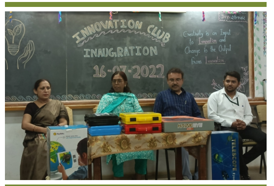
ઈનોવેશન ક્લબ ઉદ્ઘાટન