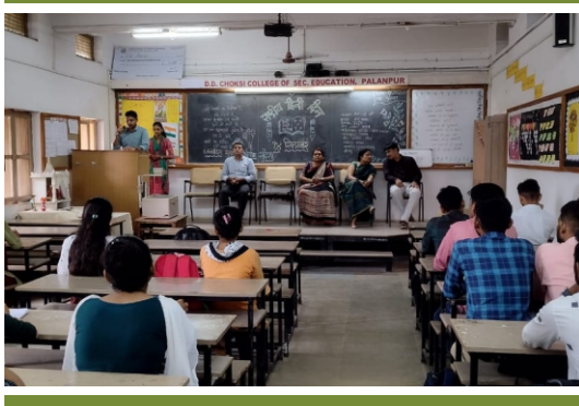
રાષ્ટ્રીય હિન્દી દિવસ