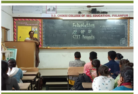
CTET ઉત્તીર્ણ થયેલા વિદ્યાર્થીઓનો સન્માન સમારોહ