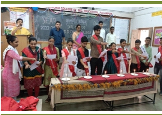
મતદાન શપથવિધિ કાર્યક્રમ