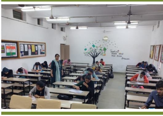
ડૉ. અબ્દુલ કલામ નિબંધ સ્પર્ધા