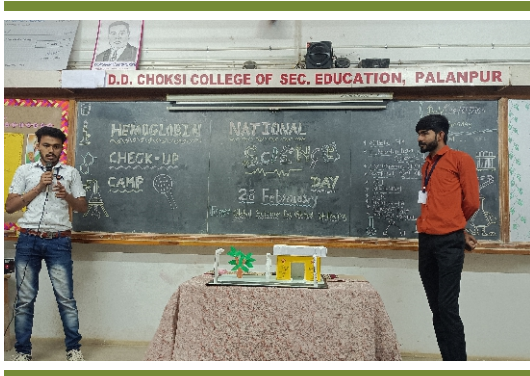
વિશ્વ વિજ્ઞાન દિવસ